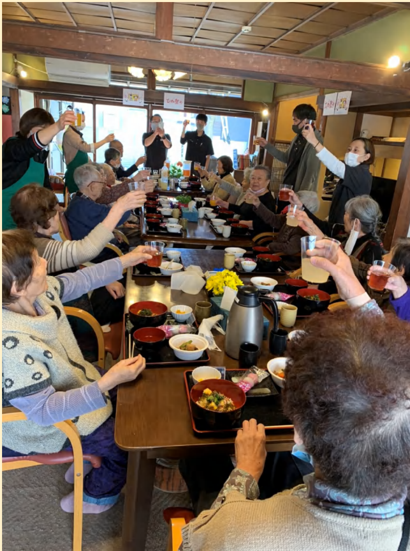
お昼ごはんは出来立て料理で大好評。 月に1度は特別なパーティー料理です。