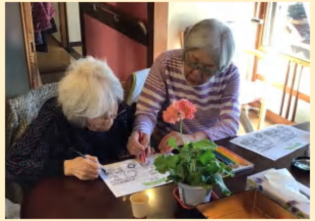
言葉あそびも皆でやれば楽しさ倍増 昔の記憶からスイスイ答えが出ます。