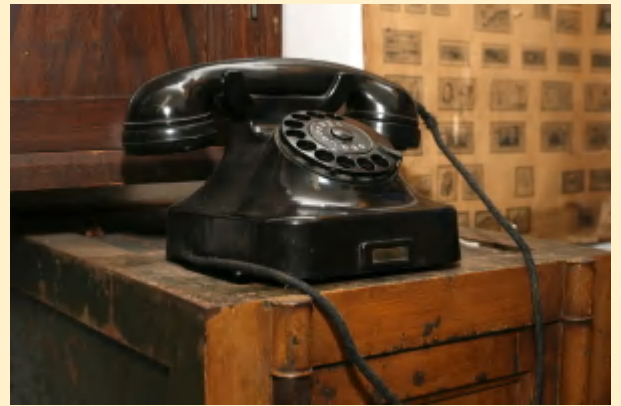
今ではもう見ない黒電話。 電電公社の時代は料金が高かったね。